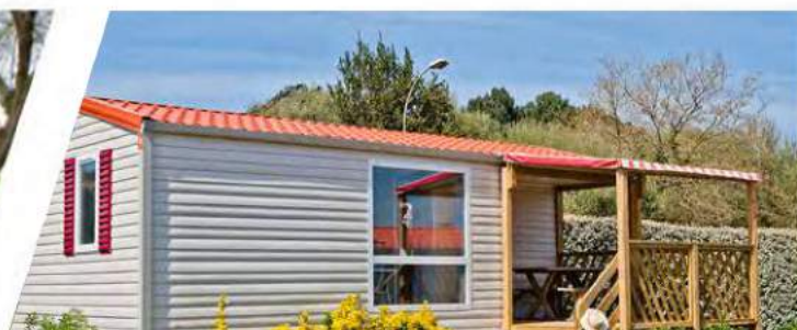
CHALET MOBILE TYPE 2 IRM LOGGIA - Année 2015 - 4 personnes 7.92m x 4m - 25 m 2 + 9 m 2 terrasse