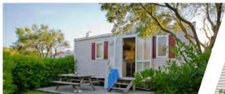
CHALET MOBILE TYPE 1 IRM SUPERMERCURE - Année 2016 4 personnes - 7.32m x 4m - 27.50m 2

Signature (à faire précéder de la mention lu et approuvé)