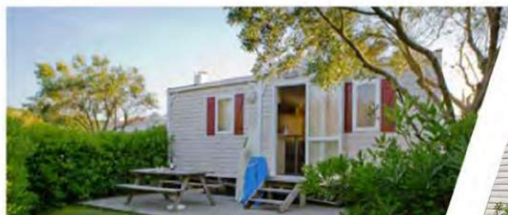
CHALET MOBILE TYPE 1 IRM SUPERMERCURE - Année 2016 4 personnes - 7.32m x 4m - 27.50m 2

Signature (à faire précéder de la mention lu et approuvé)